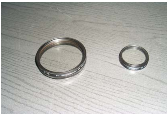
Option SINUS für verschiedene Objektive